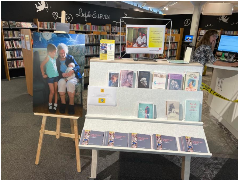
Tentoonstelling en informatiemateriaal bibliotheek